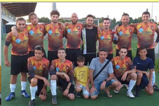
Squadra di calcio a7 torneo di Santarcangelo.