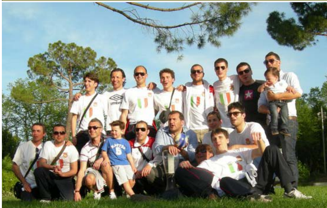
Campioni per il terzo anno consecutivo nel campionato amatori Cesena-Rimini.