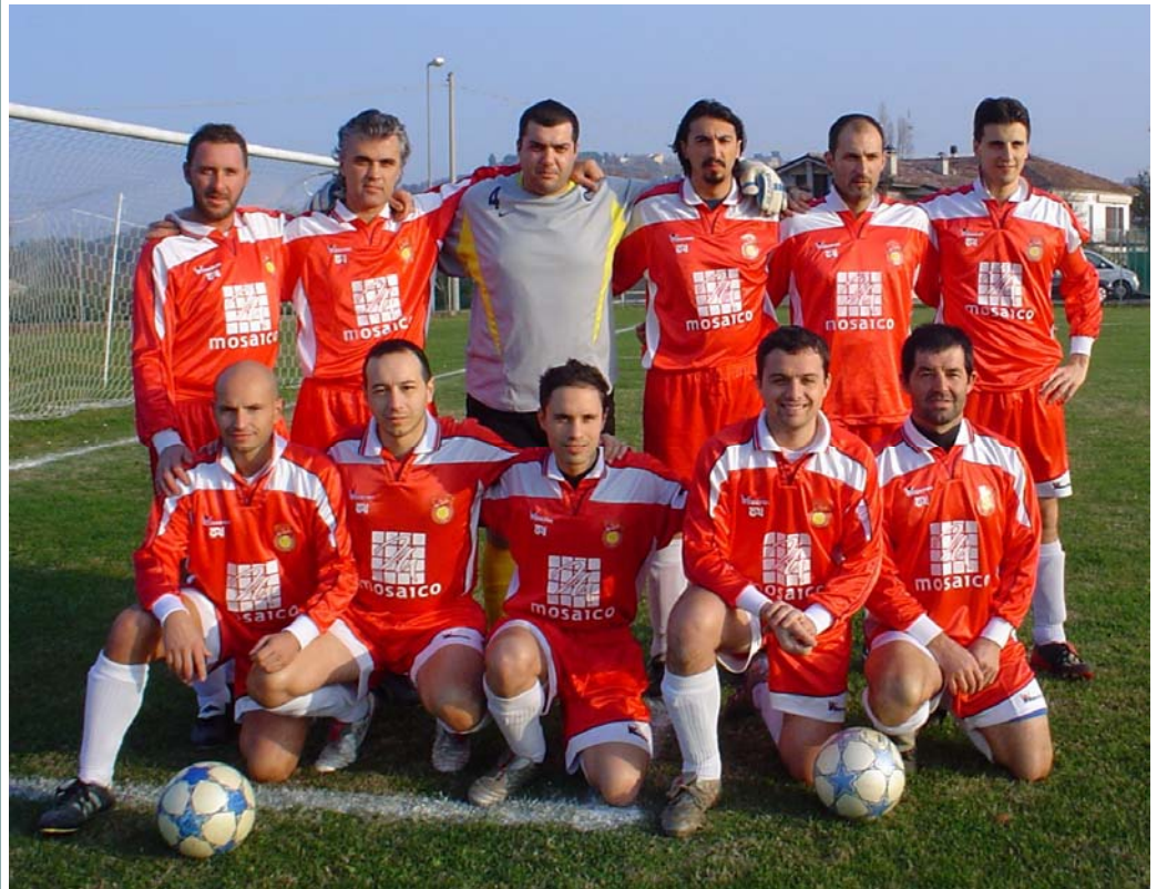
I Diavoli Rossi con la nuova divisa. Campo sportivo dello Stradone 02/12/2006.